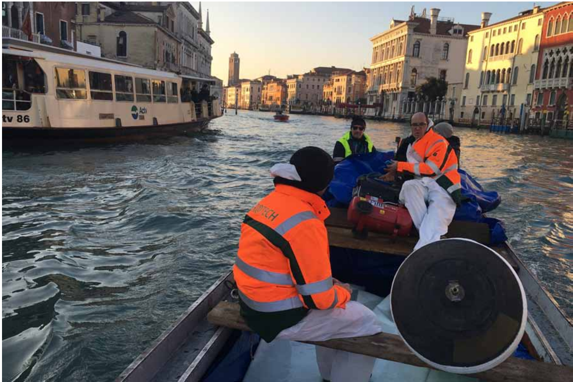
Außergewöhnlicher Anfahrtsweg: Den malerischen Weg zwischen Tränkungswerk und Einbaustelle legte der BlueLiner auf dem Canal Grande mit dem Boot zurück.