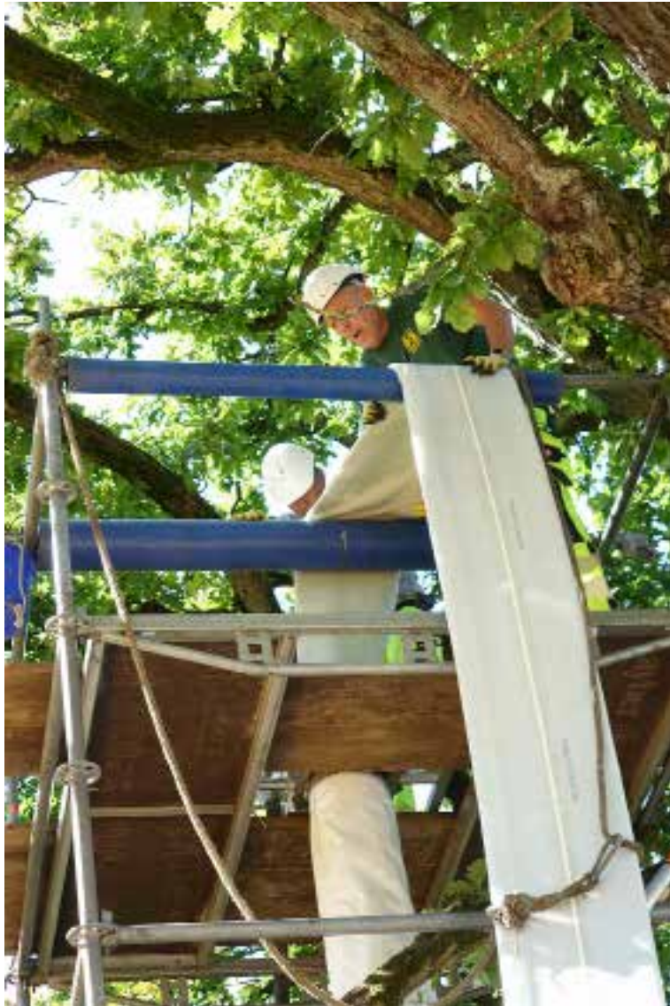
Auf dem Inversionsturm überwachen die Arbeiter den fachgerechten Einbau des Liners.