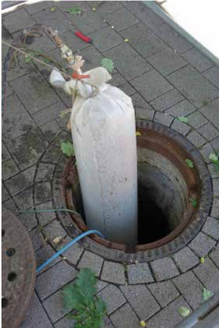
Einzug des gewebeverstärkten PVC-Preliners.